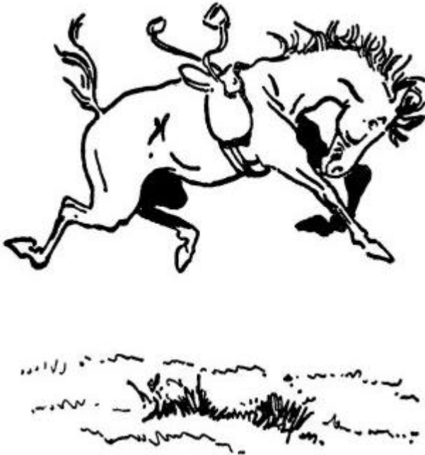
El espíritu del lunes por la mañana

Mi hijita fue tirada una vez de su caballo. Éste había estado dos días en el establo, sin ejercicio y bien alimentado con avena. Explicué su comportamiento como debido a lo que llamamos “enfermedad del lunes en la mañana” que ocurre cuando un caballo ha tenido dos días de descanso y sale al campo, lleno de energía para reanudar su trabajo.