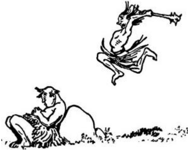
Viejo remedio para los que no hacen nada

Era una ocasión momentánea e impresionante en un punto de retomar su vida, la cual, como regla, influenciaba su carácter y su conducta posterior.