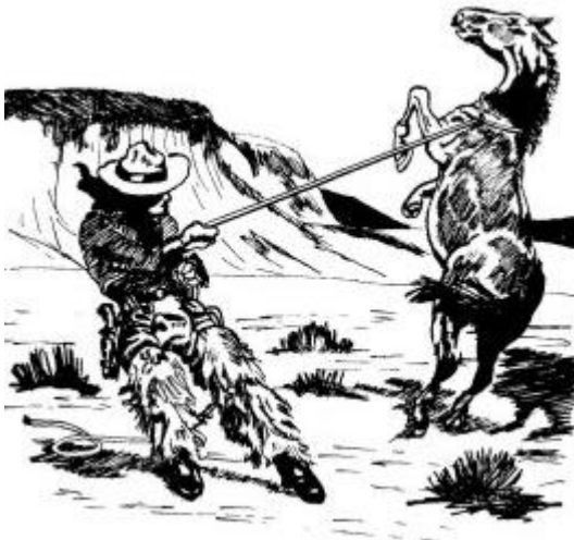
Dibujo de la portada original del libro.