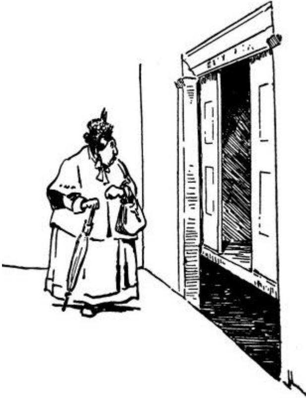
La que duda, pierde

Hay sin embargo, algunos tropiezos morales que pueden presentarse al joven que emprende el camino de la vida, y debe prevenírsele por los viejos que ya pasaron por ahí.