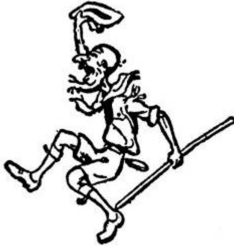
Una vez Scout, siempre Scout

Mientras comía, los soldados sudaneses, bajo la dirección de mi amigo, que en ese tiempo era sargento, apilaron pacas de algodón alrededor de la casa; y como estaba al mando, las encendió con su propia mano. El huésped se quemó como un signo de que en Sudán no querían gobernadores egipcios. Busqué el incidente en un libro de historia y encontré que realmente ocurrió casi cien años atrás y que sí el héroe fue, como lo aseguraba, sargento, bien podía decir que tenía ciento veinte años.