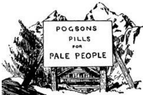
Apreciación de la belleza

El brillo cálido del sol trae consigo el olor a rosas y madre selvas que se extiende hasta el alto cielo.