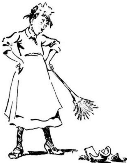
Cambio y destrucción en todo lo que veo

Por otro lado, el hábito de fumar es cómodo al fumador pero una molestia para otros, frecuentemente vulgar y él es el último en enterarse. Aún así, a diario puedes ver hombres que llenan un vagón de no fumadores con humo que se quedará ahí enfermado a las damas y a los que viajen después.